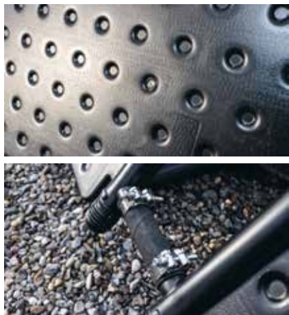
Eine Isolationsabdeckung reduziert den Wärmeverlust um 80%.